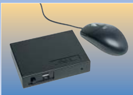
AX3000 Modell 70W